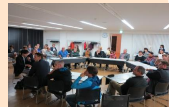
まちづくり町民講座