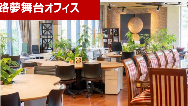
淡路夢舞台オフィス