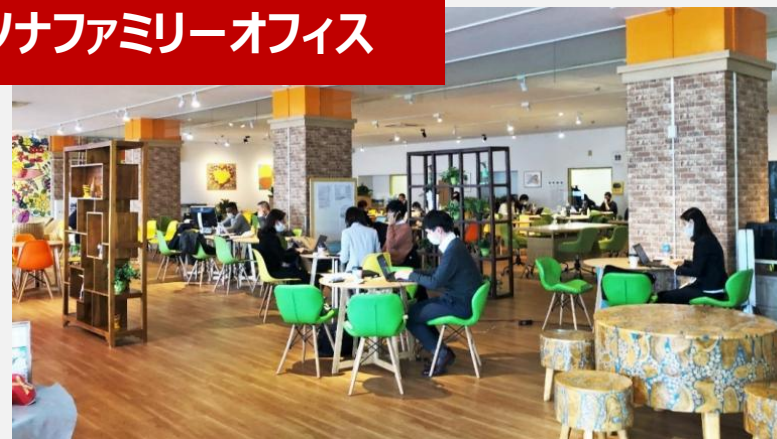
パソナファミリーオフィス