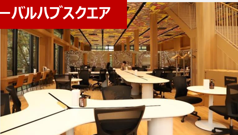
グローバルハブスクエア