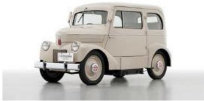
(1947) たま電気自動車 日産初のEV