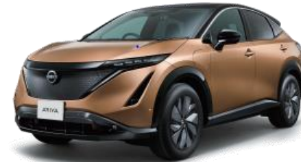
(2022) 「日産アリア」 航続距離 470～610km