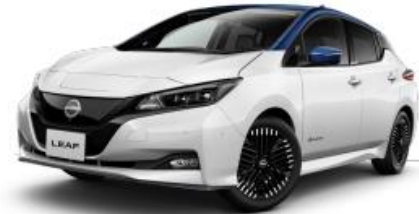
(2017) 「日産リーフ」 航続距離 322/450km