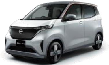
(2022) 「日産サクラ」 航続距離 180km