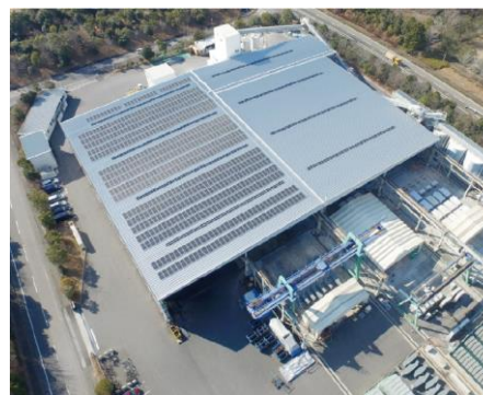
太陽光発電ESP事業 (PPA方式)