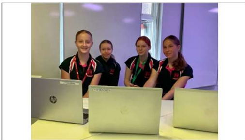
イギリスヘーゼルウッドスクールの生徒たち