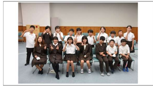
滋賀県から参加した、豊郷小学校の生徒たち