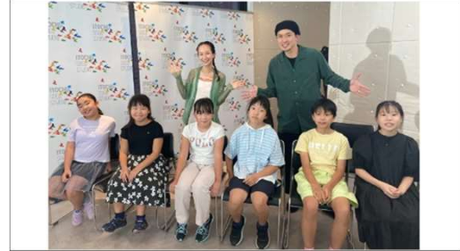
東京からは青山小学校の生徒の皆様が参加