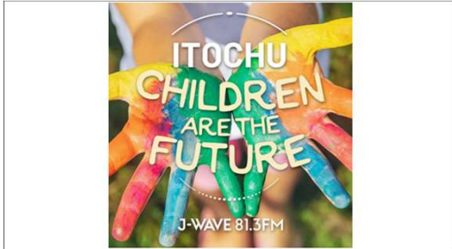
ワークショップはJWAVE特別番組で紹介

東京・イギリス・滋賀という異なる国・地域の小学生たちをオンラインで繋ぎ、各々のSDGsに関わる取組を発表する中で、互いのSDGsに対する意識や暮らし・文化の違いなどに触れ、各地域で新たなSDGsに関わる取組に繋げてもらうことを目的に開催。ワークショップは、参加した学生のみならずあらゆる地域の方に視聴頂き、気付きに繋がる様、J-WAVE特別番組で紹介、YouTube、Podcastにて配信。