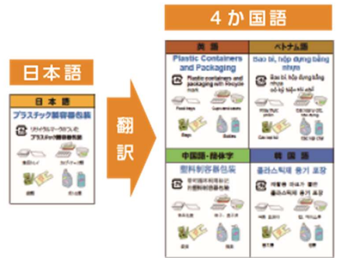
※イラストは経済産業省3R政策から使用