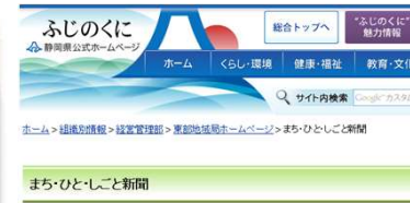
【東部地域局公式HP掲載】