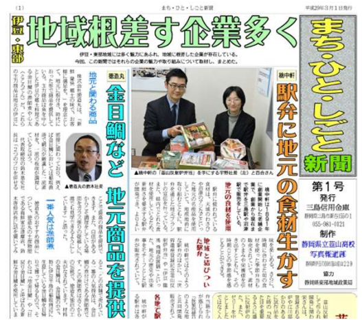
【第1号：食をテーマに地域の魅力発信】