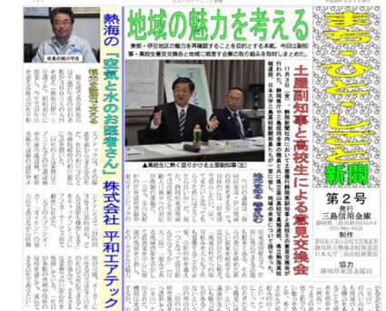
【第2号：地域創生をテーマに】