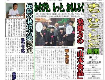
【第3号：県東部4校共同制作】